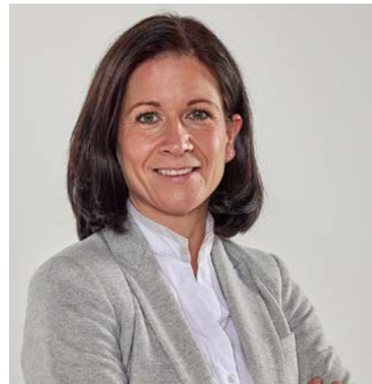
Schulsenatorin Katharina Günther-Wünsch

Schulsekretärinnen und Schulsekretäre werden oft als selbstverständlich angesehen und ihre Arbeit im Hintergrund ist nicht immer sichtbar. Daher ist es wichtig, ihre Leistungen anzuerkennen und zu würdigen. Das beinhaltet neben der monetären Anerkennung auch die Wertschätzung durch die Schulleitung,